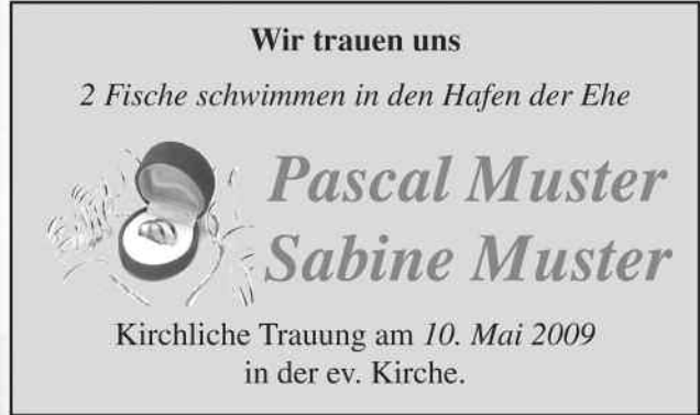
Größe 2: 2sp 50 mm