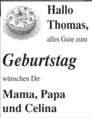
Größe 1: 1sp 50 mm