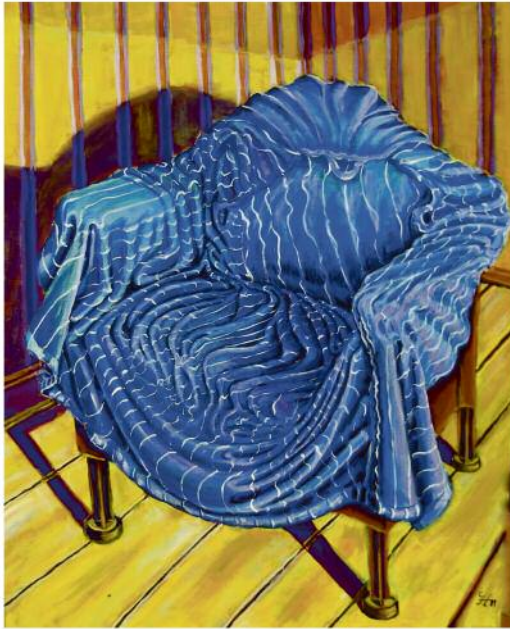
„Thron des Kleinbürgers“

Gerd Hauser „Linien, Streifen und Flächen“