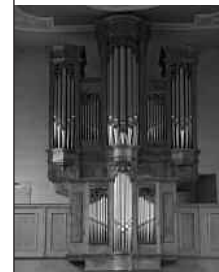
Remy Mahler-Orgel, Pfaffenhofen (1992)

Sie hören Werke von Johann Sebastian Bach, Louis-Nikolas Clérambault, Carl Philipp Emanuel Bach, Johann Christian Kittel u. a.