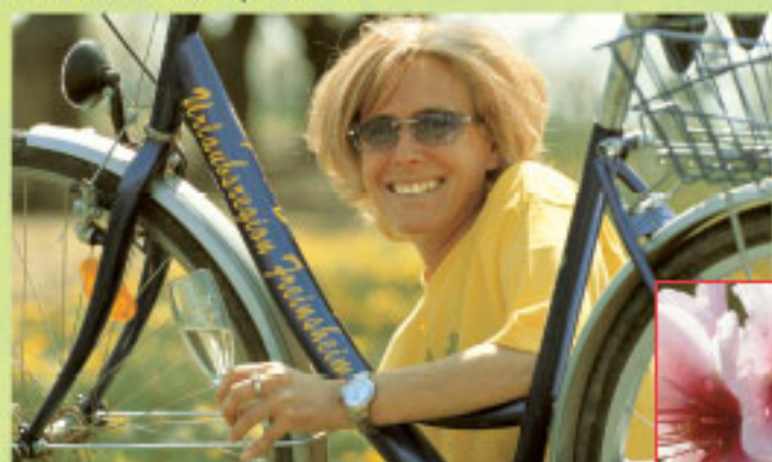
Vos chances de passer de bonnes vacances ne peuvent pas être meilleures!

Tout cela vous attend chez nous, dans le Palatinat, enrobé de 1.800 heures de soleil par ans,