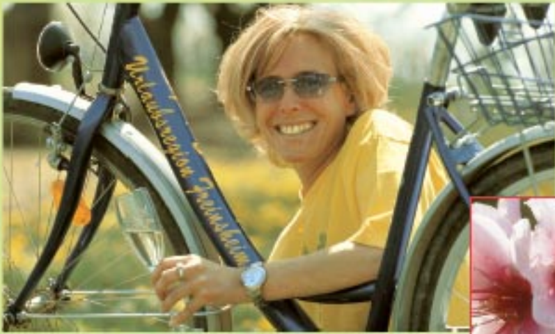
Unas condiciones óptimas para unas vacaciones perfectas.

Entre el río Rin y el bosque Palatino, al lado de la vida agitada en la región metropolitana que se encuentra entre el Rin y el río Neckar, próxima a la ciudad de Speyer en el sur, famosa por su catedral, y Worms, la ciudad de los Nibelungos en el norte, se encuentra situada la región turística de Freinsheim, en la Ruta Alemana del Vino. Entre campos de frutales, de espárragos y viñedos, están ubicados ocho pueblecitos con románticas callejuelas y patios abiertas, y además de 2.000 hectáreas de viñedos, un bosque de la misma extensión, senderos para pasear a pie o en bicicleta, limoneros, higueras, palmeras, oleandros, el maravilloso paisaje de almendros en flor, calma, cordialidad, excelente gastronomía, espárragos frescos ... Todo esto le ofrece el Palatinado en un clima suave y privilegiado con 1800 horas de sol al año.